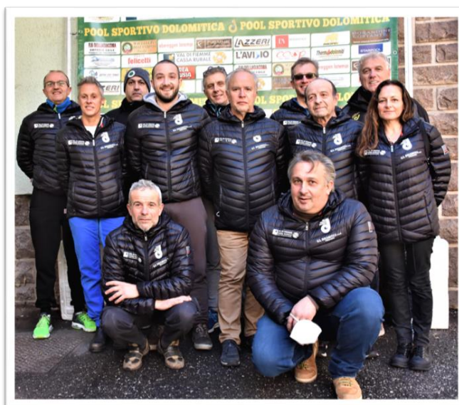
Foto direttivo del 2021 rinnovato alla assemblea di dicembre 2020 per il quadriennio 2020/2024.

Quindi, dopo aver fatto queste precisazioni, siamo ancora una volta molto soddisfatti per aver centrato anche il risultato di bilancio oltre che quello sportivo con un leggero avanzo finale di 248,48 euro.